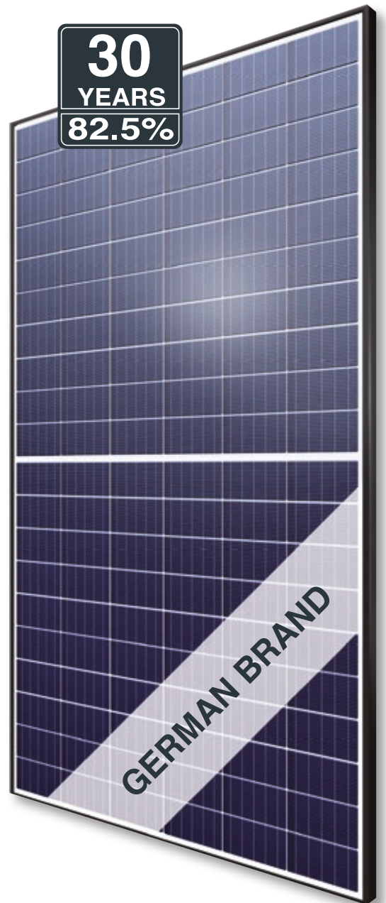
Abb. ähnlich 120MTDE210414A